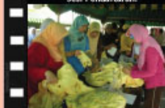
Pengagihan baju kepada jabatan yang terlibat.