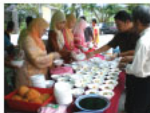
Perlepasan pada hari Jamuan oleh kakitangan Majlis Daerah SIK, Pejabat Tanah dan Daerah serta orang kampung.