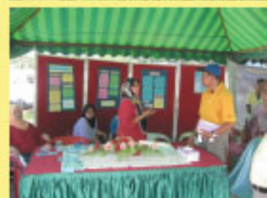
Pameran Local Agenda 21 yang telah di adakan pada 1 November 2009 bertempat di Perkarangan Bangunan Koperasi SIK.