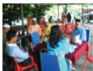
Antara tetamu kehormat yang turut hadir memeriahkan Majlis Jamuan Hari Raya Aidilfitri bertempat di perkarangan Kompleks Pentadbiran.