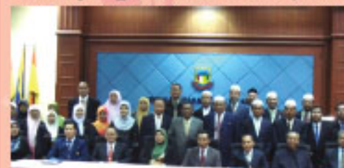
Sesi bergambar kenangan antara MDSIK dan DBKK.