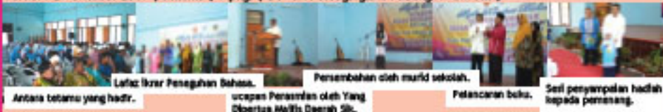
Lafaz Ikrar Penegahan Bahasa.

Tarikh : 29 Oktober 2009 | Khamis | 9 pagi | Dewan Pelbagaiguna Padang Awam SIK |