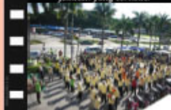
Sesi Pemanasan Badan ( senamrobik ) sebelum acara gotong-royong bermula.