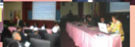
Sepanjang taklimat yang diadakan di Dewan Mesyuarat DBKK