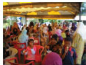
Begitulah suasana pada hari Jamuan yang dihadiri oleh penduduk Daerah SIK tidak kira usia, pengkat dan agama.