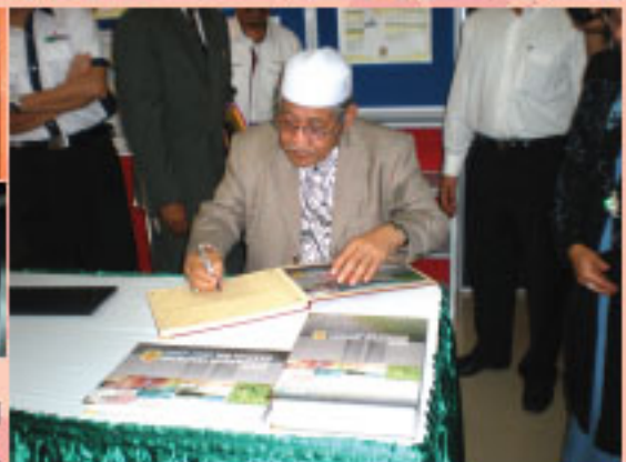
MAJLIS PERASMIAN PUBLISITI DRAFT RANCANGAN TEMPATAN DAERAH SIK