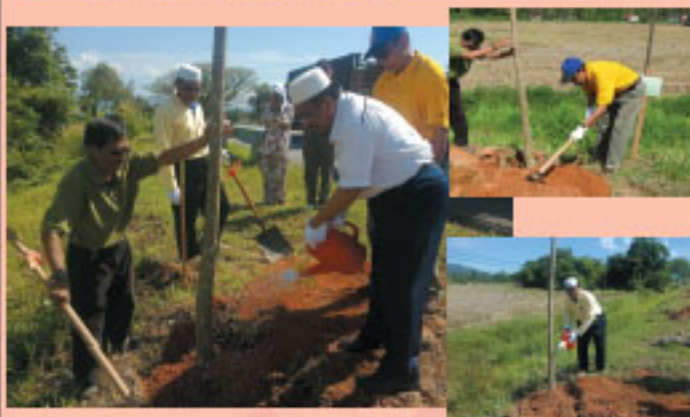
Perasmian penanaman pokok Tecoma oleh YB. Dato' Ir. Haji Fahrolrazi Haji Zawawi dan diikuti penanaman pokok oleh Tuan Haji Adzmi Bin Din.

Pada 1 November 2009 telah diadakan pelancaran 180 tanaman pokok teduhan angkat Jeris " Tecoma " yang bakal merubah wajah daerah SIK. Program ini adalah bertujuan untuk memperindah kembali landskap dan mewujudkan satu tarikan baru kepada masyarakat luar bagi melancong ke daerah SIK dan ia adalah salah satu projek perintis dalam negeri Kedah dan belum lagi dilaksanakan di daerah - daerah lain namun mendapat kerjasama yang amat baik daripada 13 jabatan kerajaan dalam daerah SIK. Setiap jabatan akan mengambil lima batang pokok untuk di jadikan pokok angkat, setiap ahli majlis dipertanggungjawab mengambil satu pokok angkat dan selebihnya akan dijaga oleh kakitangan Majlis Daerah SIK.